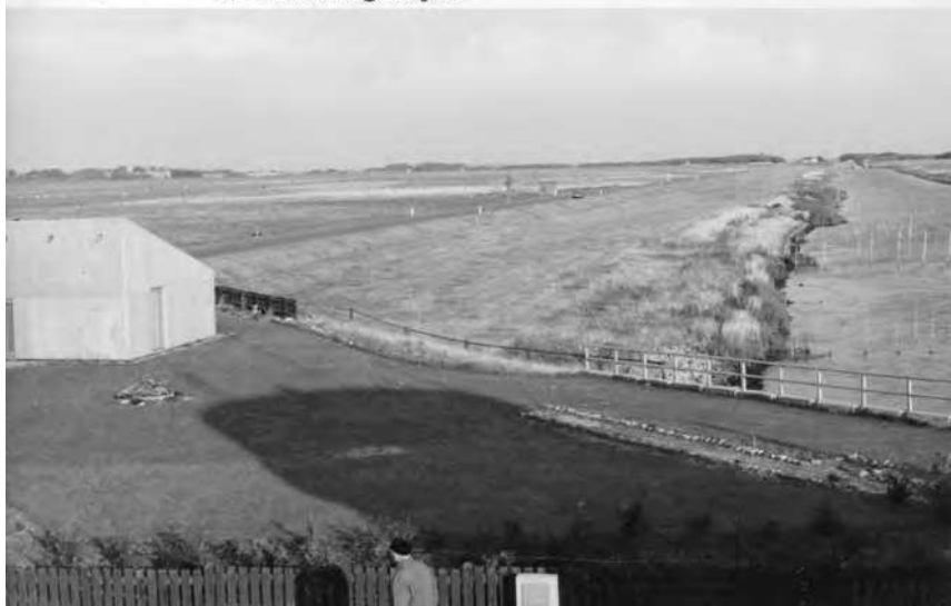
Abb. 1 Foto der Hoyerschleuse aus dem umfassenden Material, das der militärische Nachrichtendienst der DDR in den 1980er Jahren über die dänischen Küsten anfertigen ließ

Standort 13, Blick von der Schleusenanlage Hohenwarte ostwärts in Richtung Hoyer